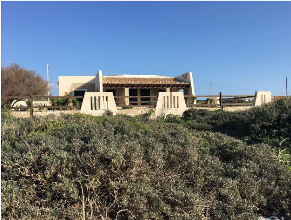
PROSPETTO OVEST – LATO MARE