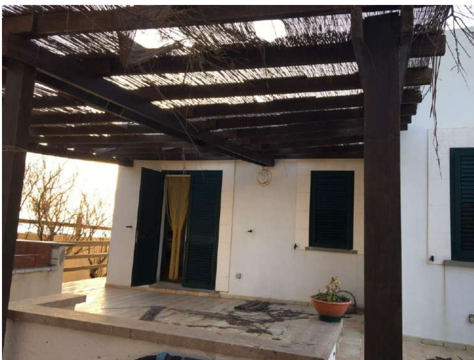
PROSPETTO EST- CUCINA